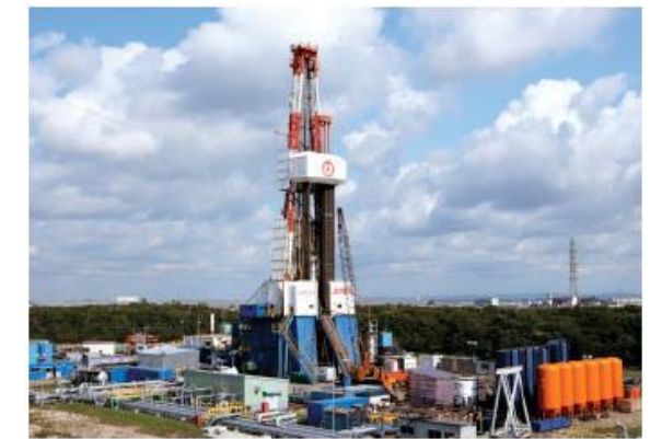
リグ（掘削機械）の完成イメージ